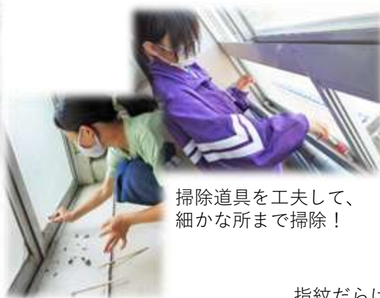
掃除道具を工夫して、 細かな所まで掃除！