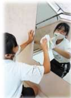
指紋だらけだった鏡がピカピカに！